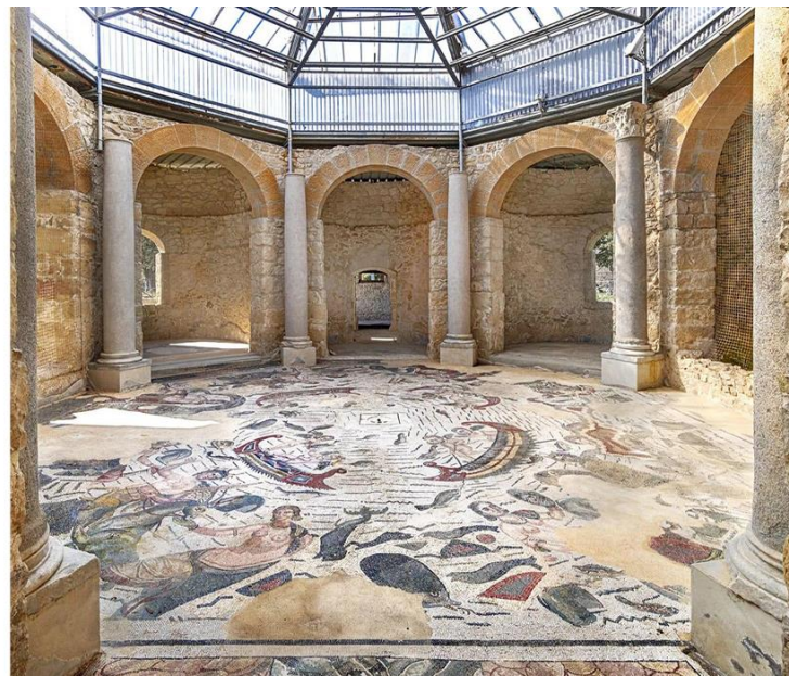
Mosaici Piazza Armerina